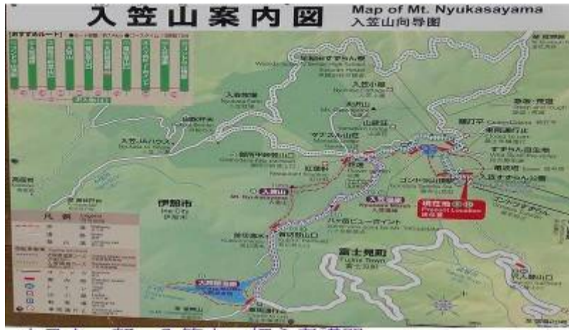
山スキー部 入笠山 初心者講習 現在地の確認と目的地までのルート説明

投稿日: 2017年 1月31日(火)00時25分17秒 通報 ( https://my.teacup.com/inform?http%3A%2F%2F6807.teacup.com%2Fgrouse%2Fbbs%2F65 )