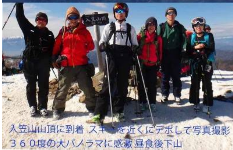
入笠山山頂に到着 スキーを近くにデポして写真撮影 360度の大パノラマに感激 昼食後下山