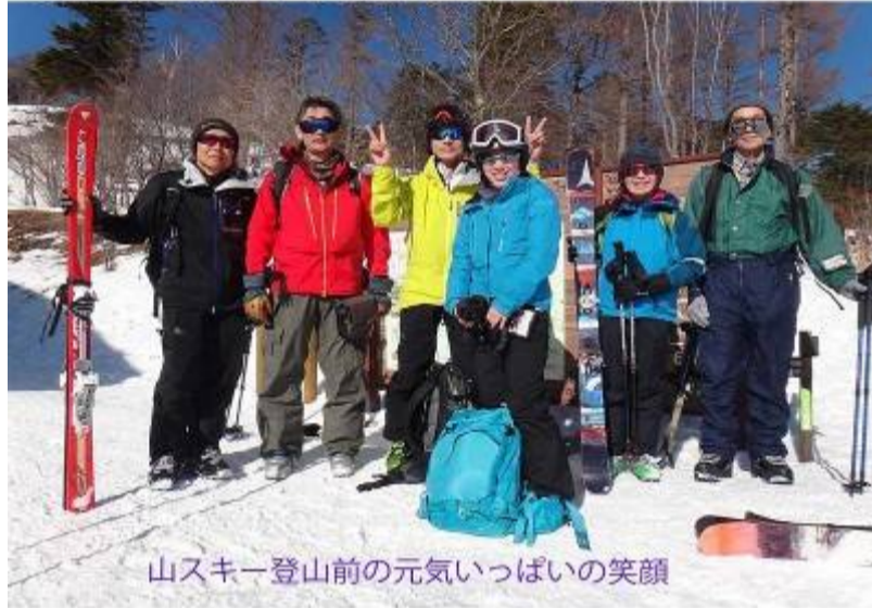
山スキー登山前の元気いっぱいの笑顔