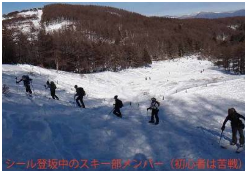
シール登坂中のスキー部メンバー（初心者苦戦）