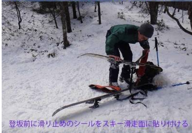
登坂前に滑り止めのシールをスキー滑走面に貼り付ける